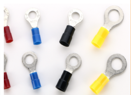
铜套端子 型号:RFL1.25-4N铜套